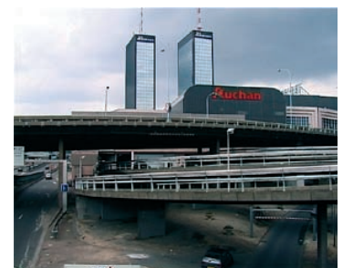
Platform, Cédric Eymenier, 2006